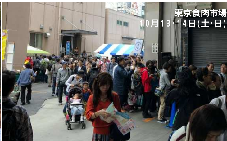
東京食肉市場 10月13・14日(土・日)