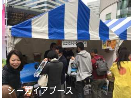
シーガイアブース